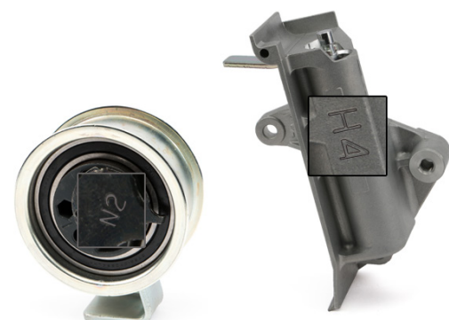
Figura 2: Rullo tenditore 531 0436 20 con smorzatore di vibrazioni 533 0035 10