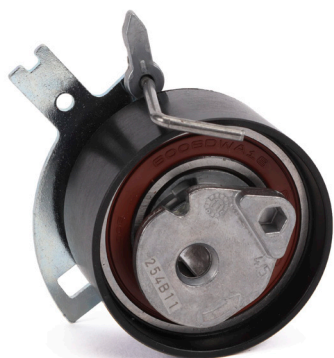
Figura 1: Rullo tenditore 531 0810 10

Entrambe le versioni soddisfano i requisiti tecnici e possono essere utilizzate senza restrizioni. Durante la fase transitoria può accadere che siano disponibili entrambi i prodotti.